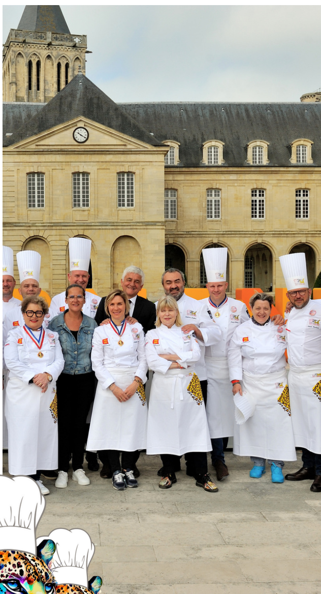
Le Trophée des Léopards : un événement Marie-Sauce Conseils

Grâce à une sélection minutieuse, les producteurs retenus pour le Trophée des Léopards représentent la diversité des terroirs de la région. À l'exception de quelques épices, l'ensemble des produits proposés aux candidats provient de fermiers, maraîchers, pêcheurs, éleveurs, distillateurs, conchyliculteurs, brasseurs et apiculteurs locaux.